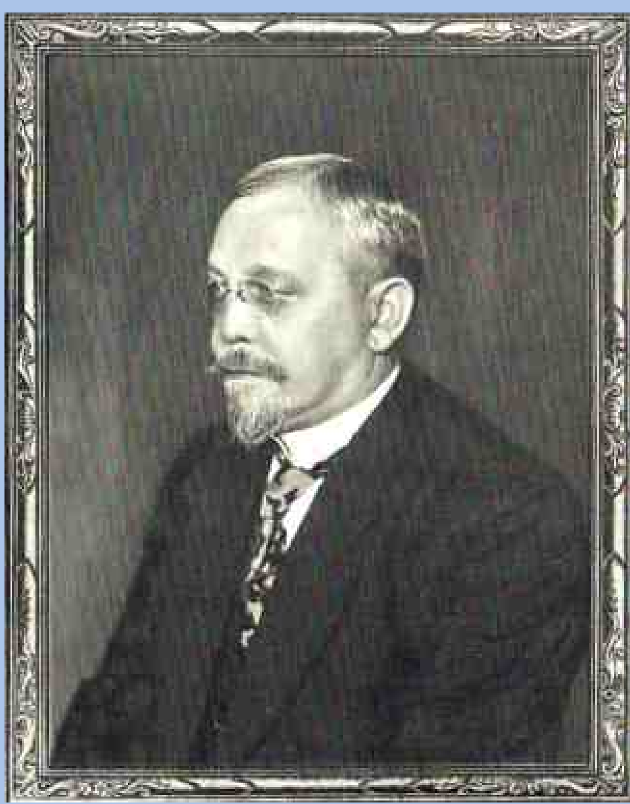
Hans Hertlein (1867 – 1937) im Jahr 1931

■ Seit den 1960er Jahren wurde über eine grundsätzliche Sanierung mit adäquater Wasseraufbereitung diskutiert. Ein wichtiger Schritt gelang erst 2008, als die Anlage aufgrund ihrer historischen Bedeutung in die Denkmalliste aufgenommen wurde. Bereits 2006 wurde von engagierten Bürgern ein Förderverein gegründet, um die Gemeinde beim Erhalt des Bades ideell und finanziell zu unterstützen. Dieses Vorhaben konnte bisher erfolgreich umgesetzt werden. Im Jahr 2020/21 wurde über eine Projektkooperation mit Gräfenberg und Egloffstein eine Projektierung zur Sanierung und Neuausrichtung der Freibäder dieser Kommunen unternommen.