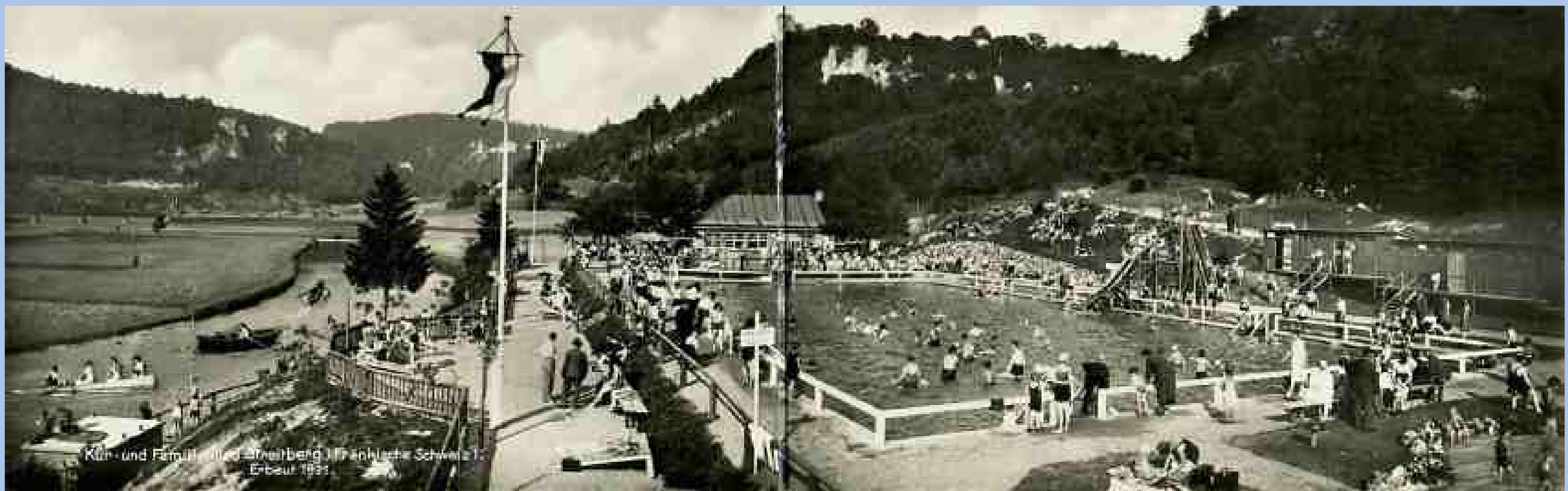
Panoramaaufnahme des Bades Streitberg um 1935

■ Nach der Bewilligung des Kredites wurde die Maßnahme in der ersten Jahreshälfte 1931 zügig umgesetzt. Die Eröffnung der Anlage wurde am 06. Juni 1931 in Anwesenheit von prominenten Gästen gefeiert. Ein kurz darauf abgeschlossener Pachtvertrag über 99 Jahre zwischen der Gemeinde und dem Verkehrsverein sollte nur wenige Jahre wirksam bleiben, da die Gleichschaltung des NS-Staates 1934 den Verein auflöste. Zunächst agierte der Gastwirt Köninger als Verwalter, mit dem 01.11.1940 übernahm die Gemeinde in eigener Regie.